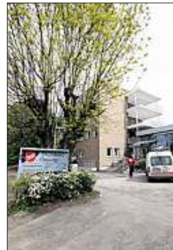
Ensjøtunet åpnet offisielt 4. mai.

Omsorg+ er Oslo kommunes boligtilbud for eldre over 67 år mellom eget hjem og sykehjem.